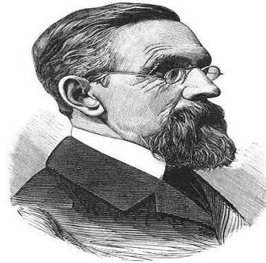
José Manuel Marroquín

(Bogotá, 1827-1908) Escritor y político colombiano que fue presidente de Colombia (1898; 1900-1904). Pertenecía a una familia de abolengo virreinal, emparentada con figuras ilustres de la Independencia y dueña de la hacienda de Yerbabuena. Quedó huérfano cuando era aún niño, y su educación tuvo todas las ventajas de una posición económica brillante y todos los inconvenientes de la falta de un hogar normal, con tíos y tías en lugar de padres. El muchacho, educado en las más rígidas normas de la buena sociedad, se fugó del primer colegio a donde lo enviaron y entró en el seminario de la Compañía de Jesús, pero no llegó a cursar estudios juniversitarios.