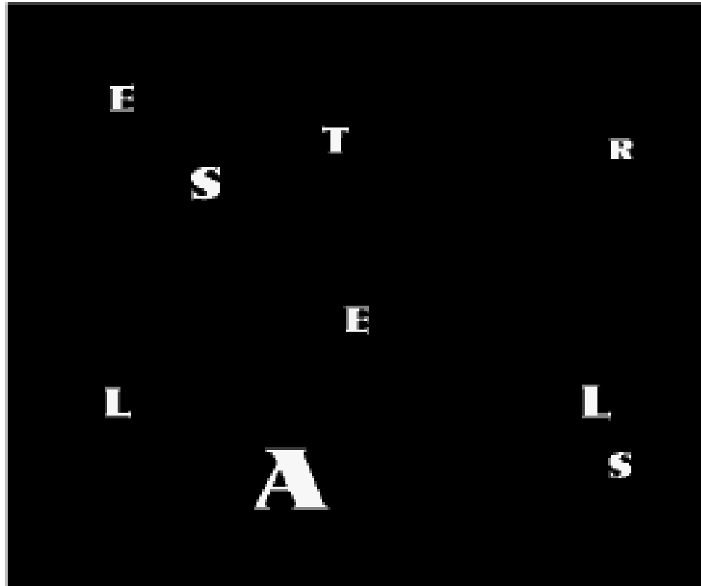
CIELO NOCTURNO. Adela de Bara, 2000